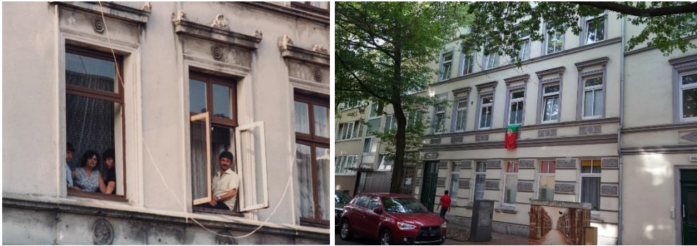
Bild 4 +5: Das Phoenixviertel rings um die Phoenixwerke im Zentrum von Harburg gilt als „Portugiesenviertel“ Harburgs, 1982 und 2024.

Die Pressebilder finden Sie als Download im Presse-Bereich auf unserer Webseite amh.de. Weitere Bilder schicken wir Ihnen auf Anfrage gern zu. Die honorarfreie Reproduktion ist nur im Rahmen der aktuellen Berichterstattung zur Ausstellung bei Nennung der vollständigen Creditline erlaubt. Mit freundlicher Bitte um Zusendung eines Belegexemplars an die Pressestelle des Archäologischen Museums Hamburg.