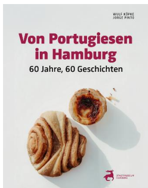
Bild 1: Titel: „Von Portugiesen in Hamburg - 60 Jahre, 60 Geschichten“.