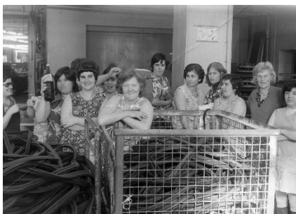
Bild 3: Arbeiten in Harburg: Arbeiterinnen in der Harburger Gummiwaren-Fabrik Phoenix in den 1960/70er-Jahren.