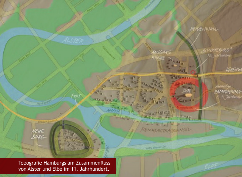
Topografie Hamburgs am Zusammenfluss von Alster und Elbe im 11. Jahrhundert.