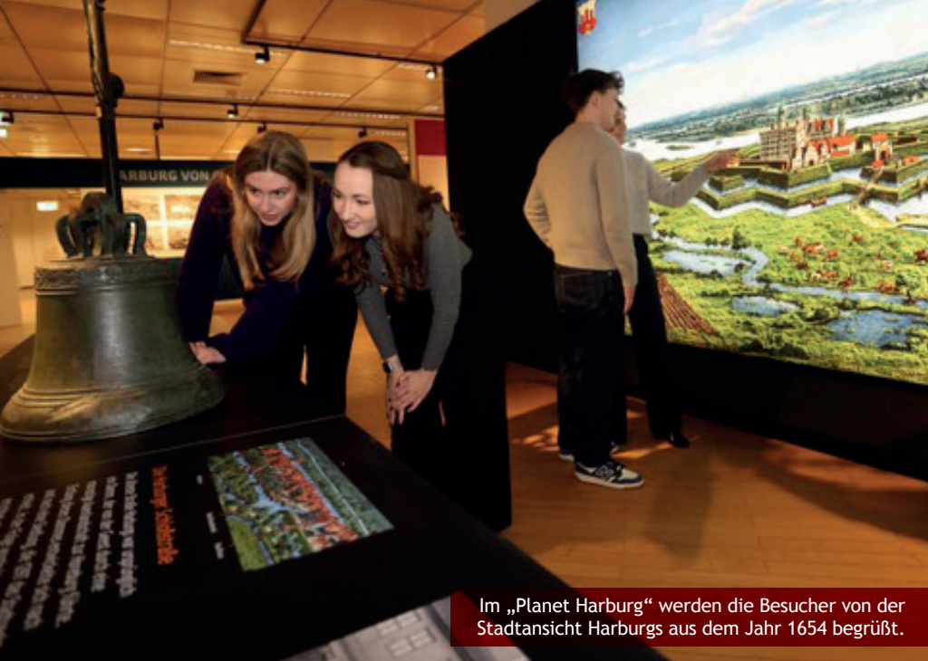
Im „Planet Harburg“ werden die Besucher von der Stadtansicht Harburgs aus dem Jahr 1654 begrüßt.