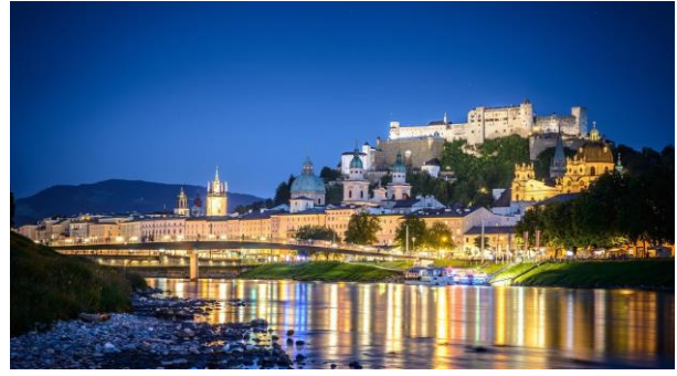
Bezauberndes Salzburg bei Nacht