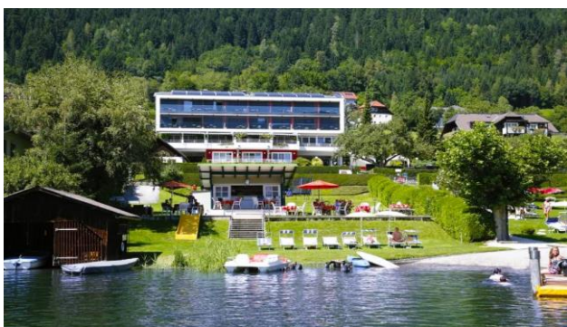
Seehotel Hoffmann **** am Ossiacher See