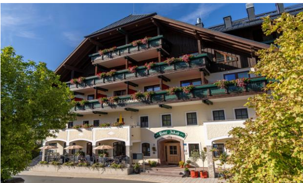
Hotel Jakob **** in Fuschl am See