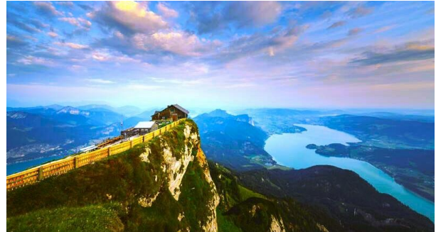
Schafbergspitze mit Himmelspforte