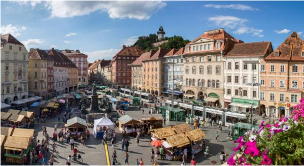
Hauptplatz Graz mit Schlossberg