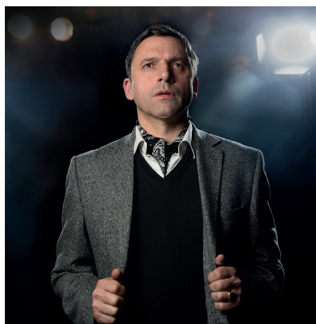
Rocko Schamoni