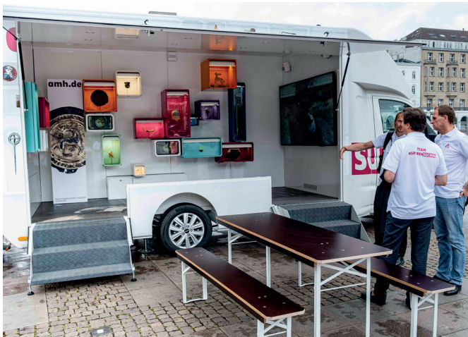
Es gibt viel zu sehen im neuen ArchäoMobil

Gruppen direkt und vor Ort ansprechen wird. Das Museum hat für die Anschaffung und den Betrieb des ArchäoMobils zusätzliche Gelder von der Behörde für Kultur und Medien erhalten, weitere Mittel hat die Johann Max Böttcher