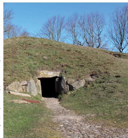
Jungsteinzeitlicher Grabhügel und ein Schatz der Wikingerzeit auf Sylt.

Die ersten Stücke dieses Hortfundes wurden in den 1960er Jahren von einer Privatperson gefunden, aber nicht alle gemeldet. Grabhügel und Hortfund stammen aus Jungsteinzeit und frühem Mittelalter. Neben der Gemeinsamkeit Sylt bieten diese Beispiele auch einen Ansatz, um die Frage nach dem Umgang mit