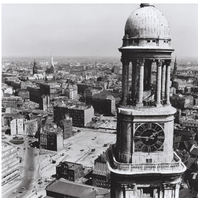
Bild 5: Der Hamburger Michel: Die Ost-West-Straße ist gerade neu im Bau und das alte Gemeindehaus steht noch. Die alte Straßenführung ging über die Michaelisstraße. Aufnahmedatum: 26.6.1959