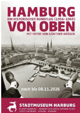
Bild 1: Ausstellungsplakat „Hamburg von oben“, Copyright: Stadtmuseum Harburg.

Hamburg von oben - Ein historischer Rundflug mit Fotos von Günther Krüger