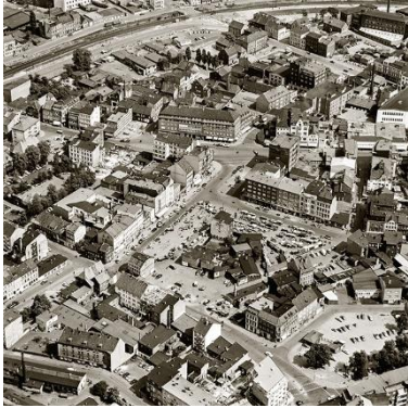
Bild 7: Harburg Sand. Harburgs Marktplatz, der Sand, ist eine Institution und seit dem 17. Jahrhundert ein zentraler Ort städtischen Lebens. Im Zweiten Weltkrieg wurden Teile der südlichen Häuserzeile zerstört und der Sand anschließend verbreitert.

Die Pressebilder finden Sie als Download im Presse-Bereich auf unserer Webseite amh.de. Weitere Bilder schicken wir Ihnen auf Anfrage gern zu. Die honorarfreie Reproduktion ist nur im Rahmen der aktuellen Berichterstattung zur Ausstellung bei Nennung der vollständigen Creditline erlaubt. Mit freundlicher Bitte um Zusendung eines Belegexemplars an die Pressestelle des Archäologischen Museums Hamburg.