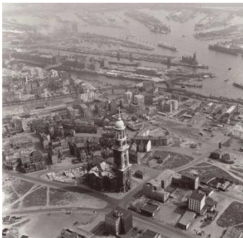
Bild 3: 1956 befand sich Hamburg mitten im Wiederaufbau. Viele freie Flächen rund um das bekannteste Wahrzeichen der Stadt, die St. Michaeliskirche, zeugen von den großflächigen