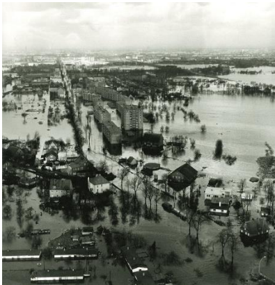
Bild 7 : Unmittelbar nach dem Orkan, der die Flutkatastrophe von 1962 auslöste, machte Krüger Fotos von dem überfluteten Wilhelmsburg und hielt die traumatische Flut in Bildern fest. Foto: Günther Krüger. Sammlung Stadtmuseum Harburg.

das traumatische Ereignis in Bildern fest. Bis heute ist die Flutkatastrophe für viele Bewohner Hamburgs unvergesslich. Foto: Günther Krüger. Sammlung Stadtmuseum Harburg.