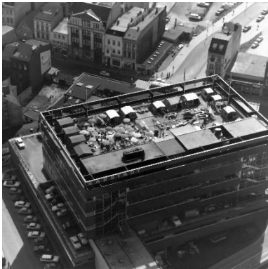
Bild 5: Zelte, Boote, Sonnenschirme: Mehrfach überfliegt Krüger zwischen 1959 und 1969 auch Harburg. Eines seiner letzten Luftbilder zeugt auf kuriose Weise vom gestiegenen Wohlstand in der Wirtschaftswunderzeit. Am 11. Juni 1969 ist auf dem Dach des Harburger Karstadt-Kaufhauses die jährliche Camping-Ausstellung zu sehen. Seit den 1950er-Jahren rollt in Westdeutschland die Campingwelle an. Viele zieht es mit Klappstühlen und Schlauchbooten an die Nord- und Ostsee oder zum Zelt-Urlaub nach Italien.