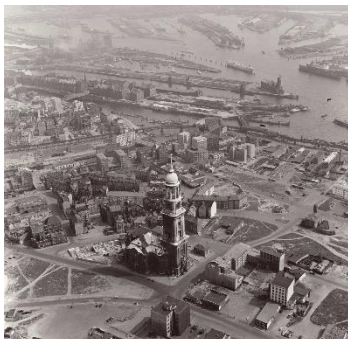
Bild 3: 1956 befand sich Hamburg mitten im Wiederaufbau. Viele freie Flächen rund um das bekannteste Wahrzeichen der Stadt, die St. Michaeliskirche, zeugen von den großflächigen Zerstörungen, die der Zweite Weltkrieg hinterlassen hat. Der Bau der Ost-West-Straße, das Entstehen der Hamburger City mit Hochhäusern, neuen Brücken und Verkehrsverbindungen - all das dokumentiert Krüger aus der Luft.