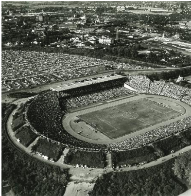
Bild 4: Am 4. Juni 1960 spielte der HSV im Volksparkstadion um die deutsche Meisterschaft. Günther Krüger schoss diese beeindruckende Aufnahme. Foto: Günther Krüger.