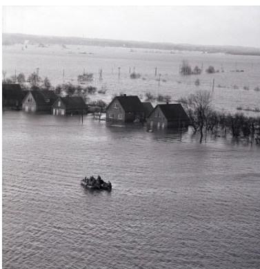
Bild 6: Die Sturmflut von 1962 - Land unter im Hamburger Süden, 18. Februar 1962: Einen Tag nachdem in der Nacht zum 17. Februar die schwere Sturmflut hereinbrach, war Günther Krüger als Fotograf des Hamburger Abendblatts mit dem Hubschrauber unterwegs und hielt