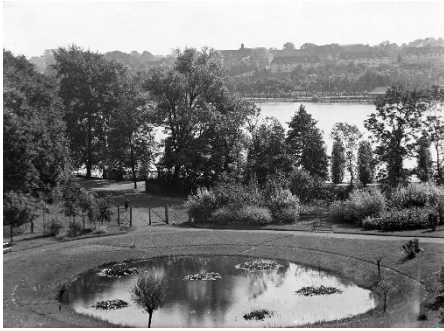
Bild 7: Teich im Schulgarten Anfang der 1930er-Jahre.