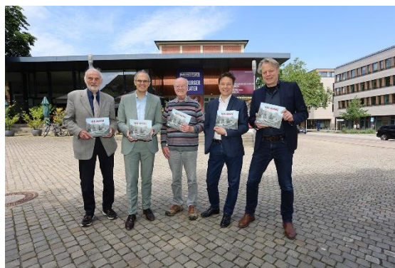
Bild 3 + 3a: Präsentation der neuen Publikation des Archäologischen Museums Hamburg und Stadtmuseums Harburg.