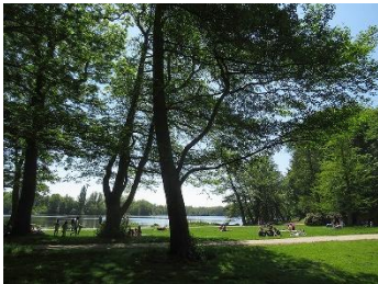
Bild 8: Liegewiese im Harburger Stadtpark im Mai.

Die Pressebilder finden Sie als Download im Presse-Bereich auf unserer Webseite amh.de. Weitere Bilder schicken wir Ihnen auf Anfrage gern zu. Die honorarfreie Reproduktion ist nur im Rahmen der aktuellen Berichterstattung zur Ausstellung bei Nennung der vollständigen Creditline erlaubt. Mit freundlicher Bitte um Zusendung eines Belegexemplars an die Pressestelle des Archäologischen Museums Hamburg.