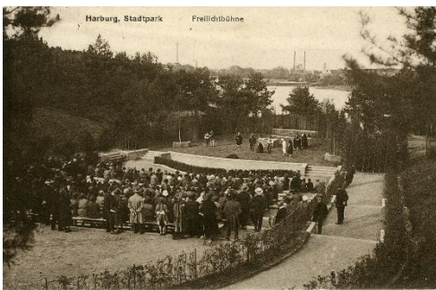
Bild 5: Eine Theateraufführung auf der 1926 eröffneten Freilichtbühne im Harburger Stadtpark.