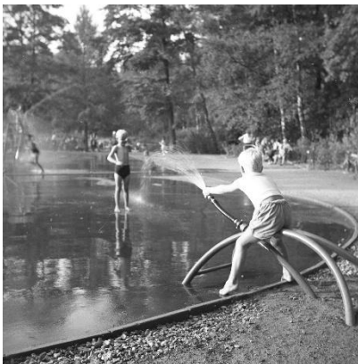
Bild 6: Der 1958 angelegte Wasserspielplatz auf dem Gelände der früheren Zündschnurfabrik.