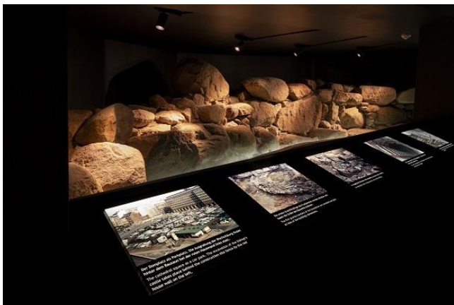
Bild 02: Die neue Ausstellung im Museum bietet spannend aufbereitete Informationen zur Bischofsburg, aber auch zu weiteren archäologischen Entdeckungen im frühen Hamburg.