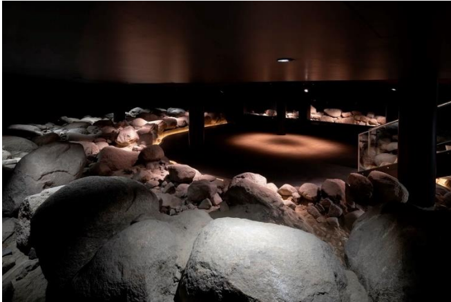
Bild 03: Das Turmfundament aus dem 12. Jahrhundert - inszeniert mit einer innovativen Lichtinstallation.