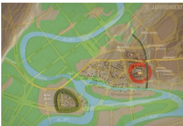
Bild 11: Karte von Hamburg im 11. Jahrhundert auf dem heutigen Straßennetz. Bischofsburg: Genau hier führt die älteste befestigte Straße der Stadt, die Steinstraße, durch den Heidenwall, Hamburgs früheste Stadtbefestigung. Illustration: Roland Warzecha.