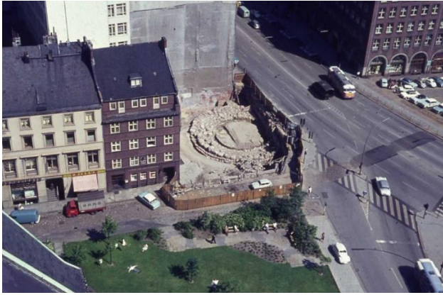
Bild 06: Blick vom Turm der Hauptkirche Sankt Petri auf den Steinring während der Ausgrabungen in den 1960er-Jahren. Das ringförmige Turmfundament aus dem 12. Jahrhundert mit seinen 19 Metern Durchmesser ist das älteste erhaltene Gebäude Hamburgs.