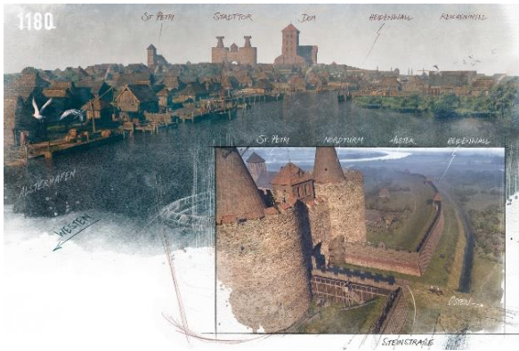
Bild 09: Rekonstruktion: Blick auf Hamburg im 12. Jahrhundert. Illustration: Roland Warzecha.