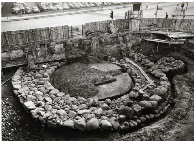
Bild 07: Blick auf die Ausgrabungen in den 1960er-Jahren und auf den gewaltigen Steinring aus Findlingen. Ein an die Westseite angebauter kleiner Steinring gehört zu einem Brunnenschacht, der heute noch über vier Meter tief in den Untergrund reicht.