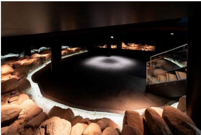
Bild 04: Im Mittelpunkt des „Museum - Die Bischofsburg“ steht das imposante Turmfundament aus dem 12. Jahrhundert, eines der wichtigsten Denkmäler der Stadt.