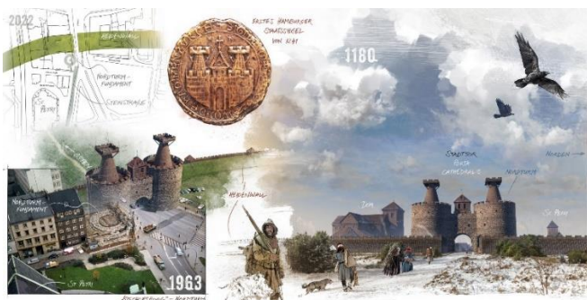
Bild 08: Rekonstruktion: Das Turmfundament der „Bischofsburg“ gehört möglicherweise zum ältesten Hamburger Stadttor. Die Rekonstruktion basiert auf dem ersten Staatssiegel von 1241. Der Südturm könnte noch unter der Straße Speersort im Boden liegen. Illustration: Roland Warzecha.