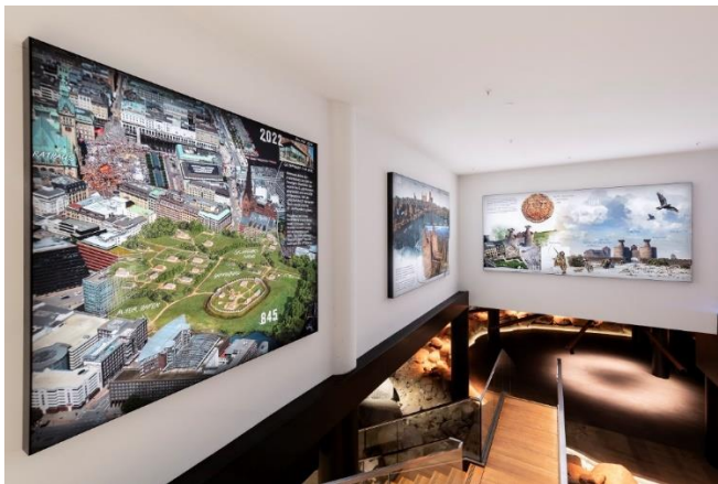
Bild 01: Blick in den Eingangsbereich des neu eröffneten „Museum - Die Bischofsburg“.