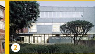
2 Archäologisches Museum