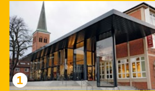
1 Stadtmuseum & Restaurant