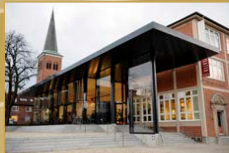
ARCHÄOLOGISCHES MUSEUM HAMBURG

Das Museum ist nur eine Minute von der S-Bahn Station »Harburg Rathaus« entfernt.